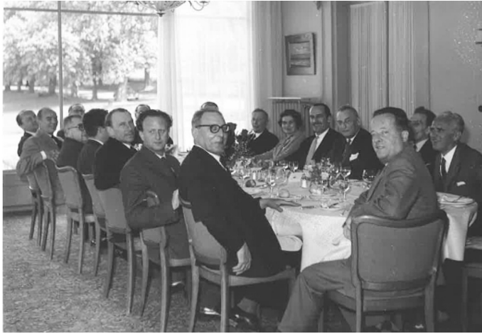
図3 1960年ジュネーヴ総会での昼食会の様子